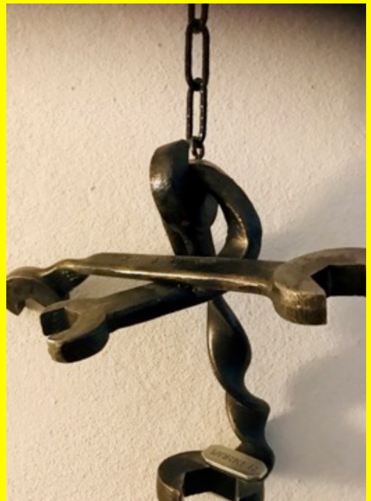
Figuren von Urs Lendi (aus dem Zyklus "Homo mechanicus")